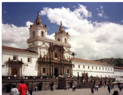
Quito, sede de CULTOUR, ha sido declarada este año como Capital Americana de la Cultura

Ecuador. La primera y única feria de turismo del mundo dirigida exclusivamente al segmento de los viajes culturales, CULTOUR, reunirá desde el próximo miércoles en Quito a unos 15 representantes de la prensa de viajes, que provienen de 11 países y estarán cubriendo el evento durante sus tres jornadas, según informaron desde el comité organizador.